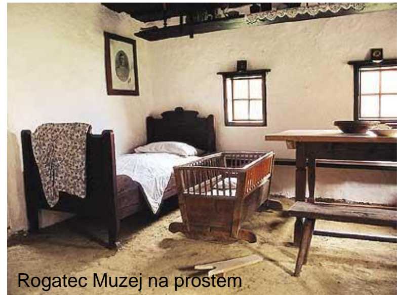
Rogatec Muzej na prostem