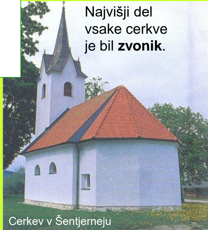
Cerkev v Šentjerneju

Najvišji del vsake cerkve je bil zvonik .