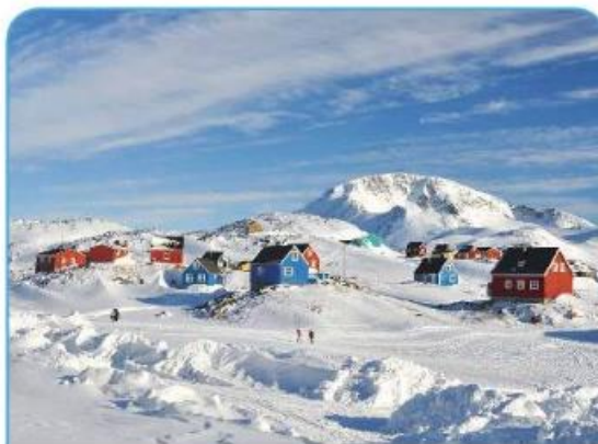
Hiše na severnem polarnem območju