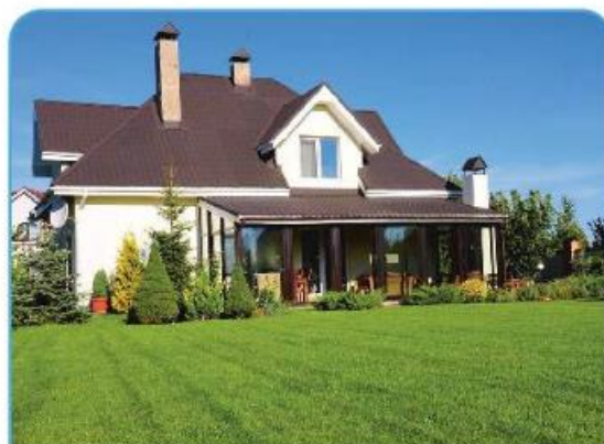
Moderna evropska hiša