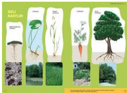
Slika: Prikaz delov rastline