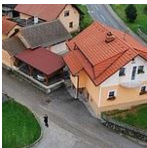
Slika 1: Pogled iz zraka na okolico OŠ Mirna Peč