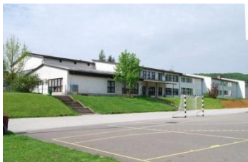
Slika 1: Osnovna šola Mirna Peč

Primer 1: slikovno gradivo s spleta, knjig, revij